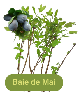
Baie de Mai