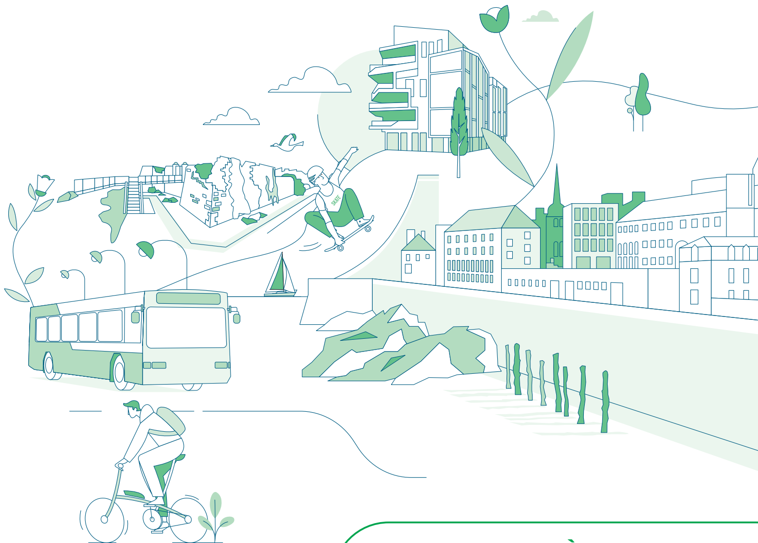
TABLEAU DE SYNTHÈSE DES MODIFICATIONS APRÈS L'ENQUÊTE PUBLIQUE

Acte publié le : 05/11/2025 Envoyé en Préfecture le : 05/11/2025 05/11/2025 Reçu Préfecture le : 05/11/2025 Identifiant de télétransmission : 035-213502883-20251104-75701-DE-1-1