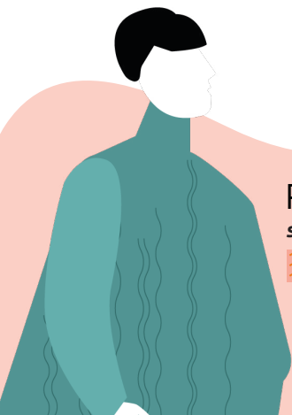
PIERRE, 53 ANS s'occupe d'un parent âgé