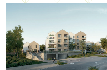
Bati-Armor - Major Document non contractuel.