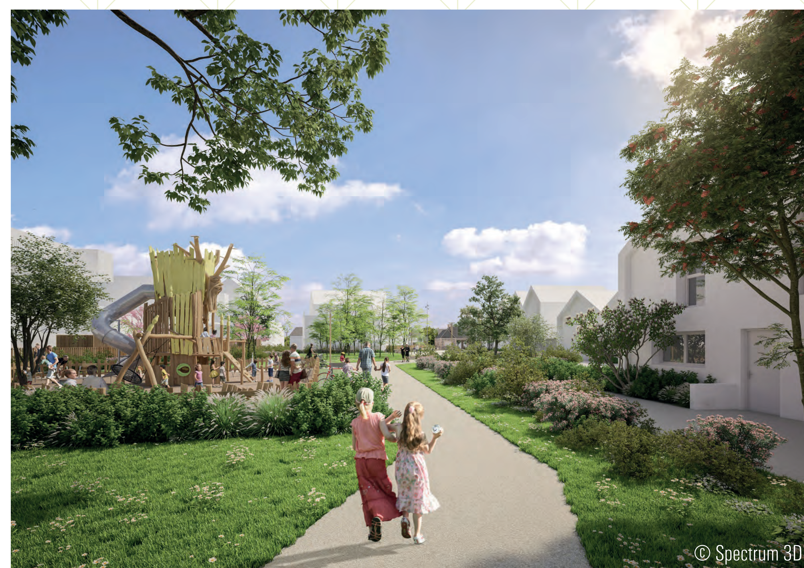
L'aire de jeux