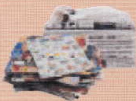
journaux, magazines, prospectus

CONSIGNES DE TRI : JETEZ UNIQUEMENT LES EMBALLAGES MÉNAGERS À RECYCLER, BIEN VIDÉS DE LEUR CONTENU.