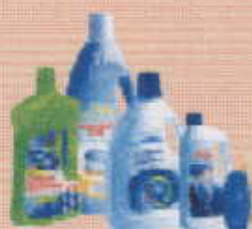
flacons ménagers ou de toilette + bouchons