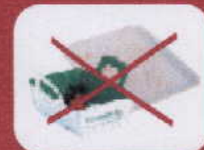
emballages salis barquettes en polystyrène