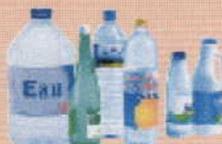
bouteilles plastiques + bouchons