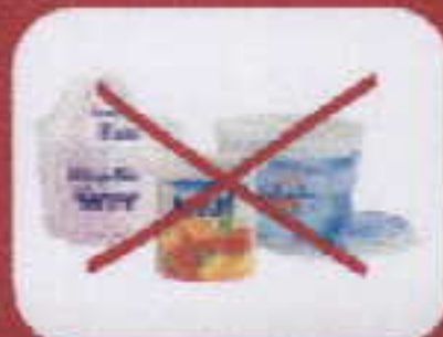
pots de yaourts