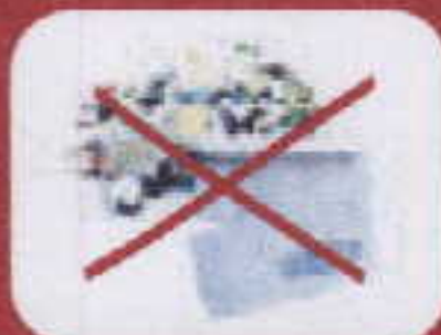
enveloppes bouts de papier