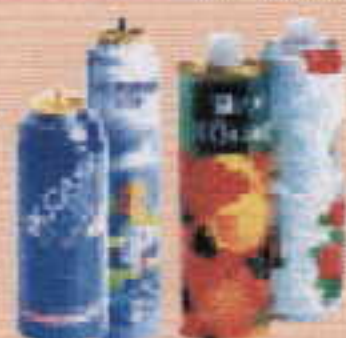
aérosols, boîte de sirop