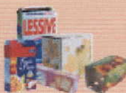
boîtes et suremballages en carton