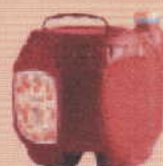
cubitainers plastiques + bouchons