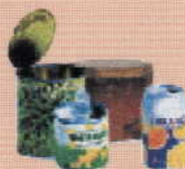
boîtes de boisson et de conserves